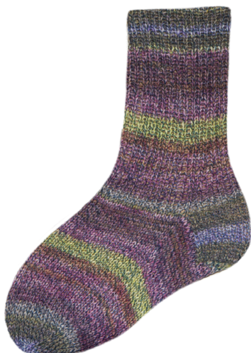
1863 | 7093 4f. | 6f.