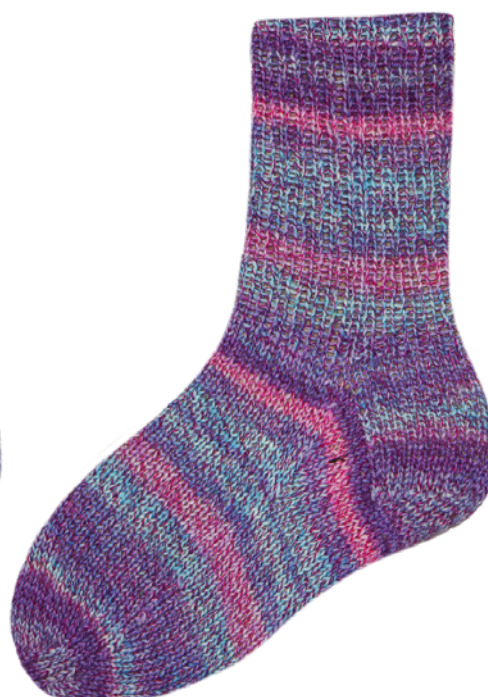
1864 | 7094 4f. | 6f.

Die einzigartige Optik entsteht dadurch, dass zunächst 3 (6f.: 4) Fäden verzwirrt und bedruckt werden und anschließend mit 1 (6f.: 2) farblich abgestimmten uni-Fäden verzwirrt werden.