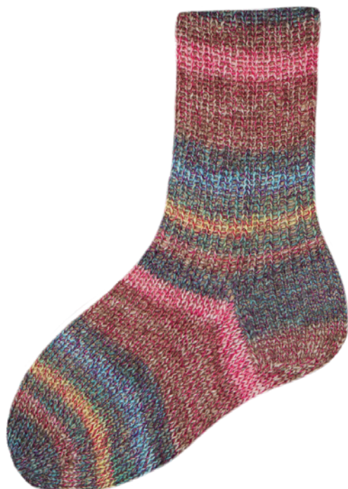
1860 | 7090 4f. | 6f.