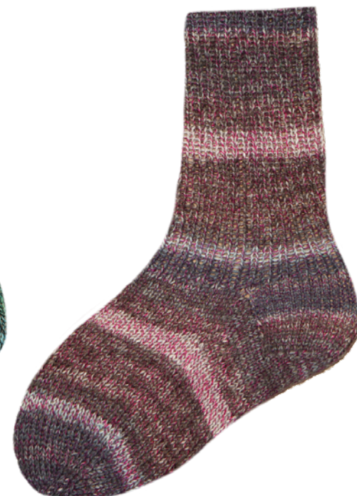
1862 | 7092 4f. | 6f.