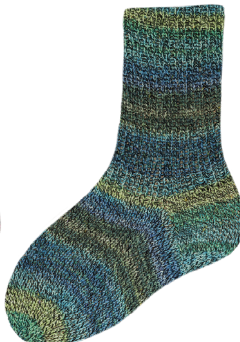
1861 | 7091 4f. | 6f.