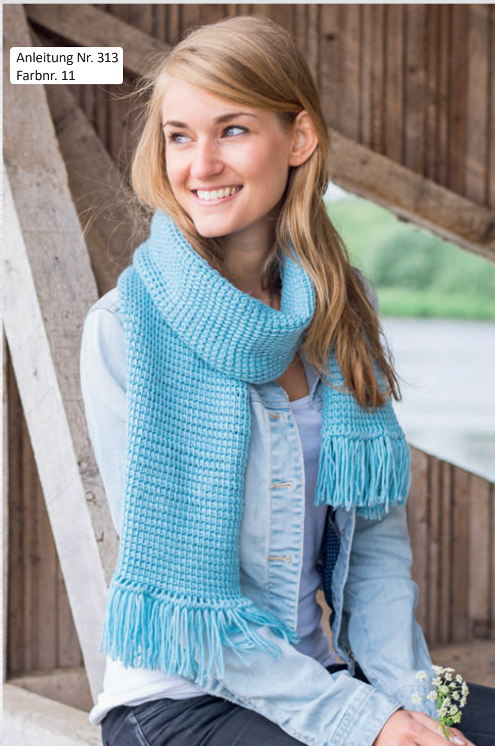
Anleitung Nr. 313 Farbnr. 11

Durch ein patentiertes Verfahren ist dieses Garn mit einer speziellen Anti-Pilling Ausrüstung ausgestattet und wird mit jeder Wäsche schöner.