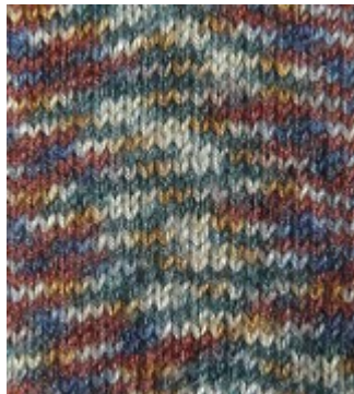
Neu ! 4009 braun-grün-blau