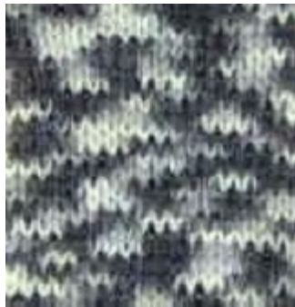
Neu ! 4007 hellgrau-dkl.-grau-schwarz