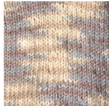
Neu ! 4008 natur-beige-stein