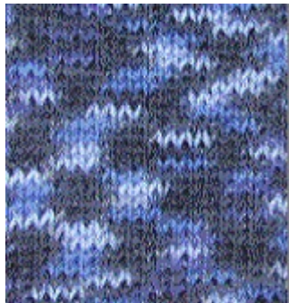
Neu ! 4006 hellblau-jeans-marine